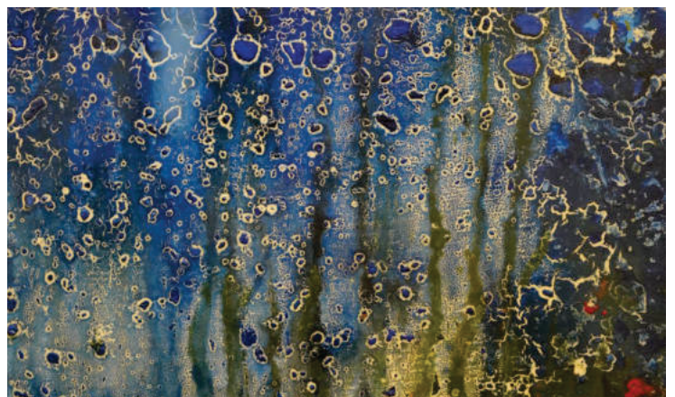
Elfriede Fulda: Tanzende Tropfen (ca. 1993)